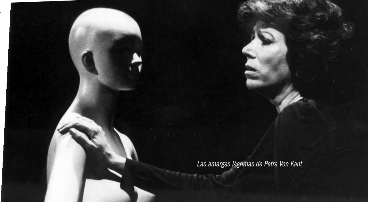
Las amargas lágrimas de Petra Von Kant