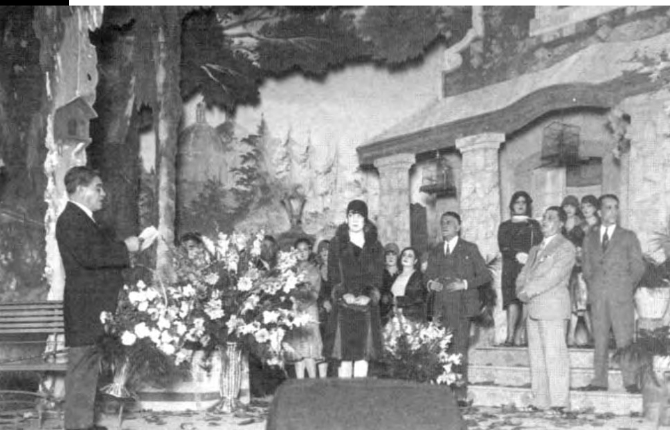
Cuando las hojas caen