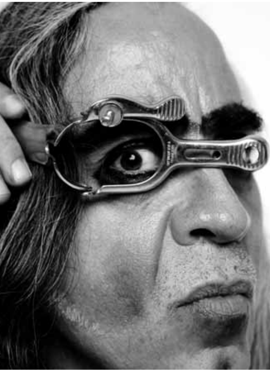
Guillermo Gómez-Peña en Strange Democracy.